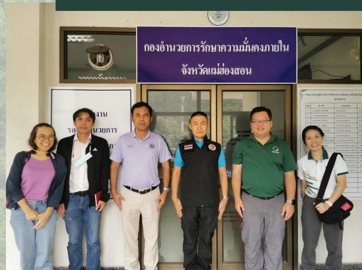
เข้าพบผู้แทน กอรมน. จังหวัดแม่ฮ่องสอน