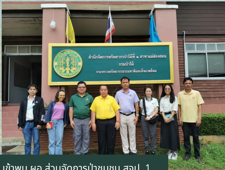
เข้าพบ ผอ.ส่วนจัดการป่าชุมชน สอป. 1 สาขาแม่ฮ่องสอน

และช่วงสายของวันที่ 5 สิงหาคม ทางคณะทำงาน ได้เข้าพบ หน่วยงานรักษาความมั่นคงภายใน จังหวัดแม่ฮ่องสอน การนี้ทางคณะฯ ได้หารือและชี้แจงรายละเอียดโครงการฯ กับทาง กอรมน. และพูดคุยเกี่ยวกับสถานการณ์ชายแดนไทย – เมียนมาร์ โดยทางคณะทำงานได้หารือในเรื่องของการใช้โดรนในพื้นที่ ซึ่งในเบื้องต้น ทาง กอรมน. ได้อนุมัติให้ทำการบินได้ในช่วงเดือน พฤศจิกายน – ธันวาคม 2567