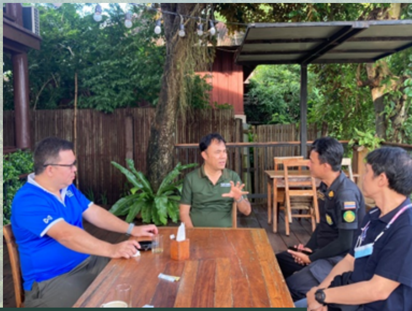
หารือกับทางเจ้าหน้าที่ (คุณต้น) ก่อนลงพื้นที่