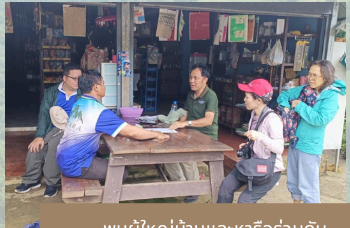
พบผู้ใหญ่บ้านและหารือร่วมกัน