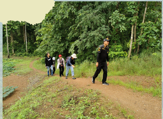
กำนันบ้านทุ่งแพมนำดูป่าชุมชนและเล่าถึงการจัดการป่า