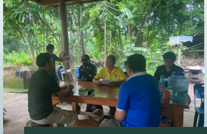
พบผู้ใหญ่บ้านแม่ทะลุและหารือร่วมกัน